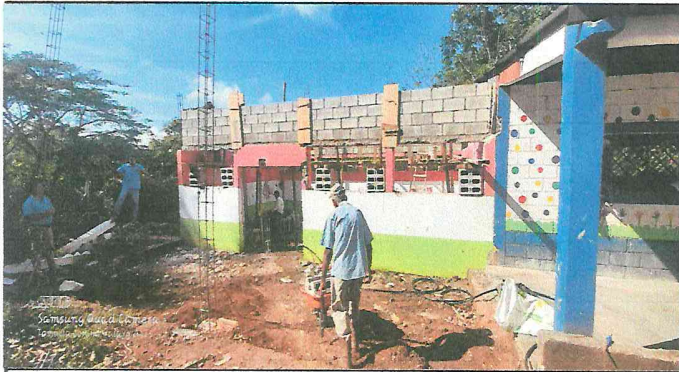
Foto 1: reforzando las paredes del salón para instalar estructura metálica.